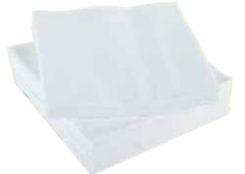
Beyaz peçete veya mutfak kâğıdı