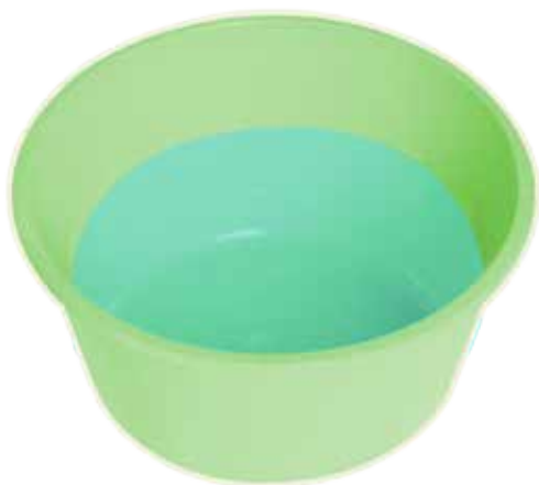
Миска с теплой водой

Хороший гребень для вычесывания вшей вы можете купить в аптеке. У такой расчески очень мелкие, жесткие, загнутые зубцы, которые расположены очень близко друг к другу.