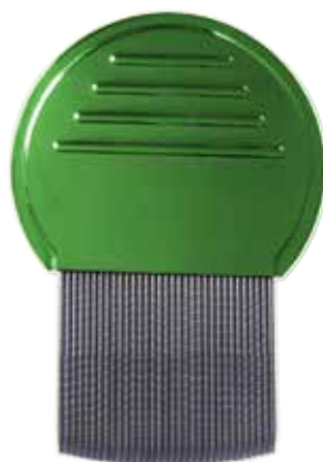
Гребень от вшей

Хороший гребень для вычесывания вшей вы можете купить в аптеке. У такой расчески очень мелкие, жесткие, загнутые зубцы, которые расположены очень близко друг к другу.