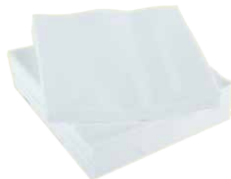
Белые салфетки или бумажные полотенца