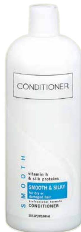
Крем-ополаскиватель, кондиционер или бальзам